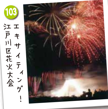
103 エキサイティング！ 江戸川区花火大会

区民の熱意と心意気により昭和51年から開催されている全国でも有数の規模を誇る花火大会です。