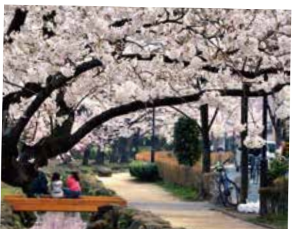
106 桜の名所 篠田堀親水緑道

初代中村勘三郎など歌舞伎俳優の墓が多いことから、「役者寺」として知られています。