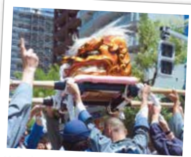
105 江戸から伝わる 篠崎本郷の獅子もみ

江戸時代に始まった無病息災を祈る行事で、黄金色の獅子頭を担いで町内を練り歩きます。