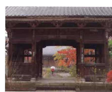
110 歌舞伎役者が眠る 「役者寺」大雲寺

江戸時代のはじめに一之江新田を開発し、元禄時代以降、名主を務めていた田島家の住居です。