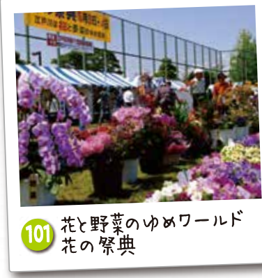
101 花と野菜のゆめワールド 花の祭典

花と野菜の生産が盛んな江戸川区ならではイベントで、ゴールデンウィークに開催されます。