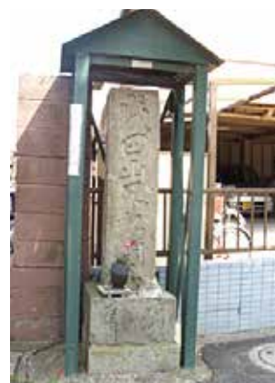
成田山不動明王石造道標 (瑞江南コース付近)

現在は河川水質などの環境も復元し、防災船着き場や集合住宅、スポーツ施設などが整備され、災害時の避難場所も多く指定されています。