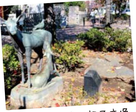
93 地名の由来 親子鹿像 鹿骨親水緑道

鹿骨の地名の由来と言われる鹿見塚の脇を流れる親水緑道で、親子鹿のモニュメントがあります。