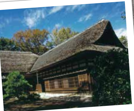
109 江戸の面影残す 一之江名主屋敷

鹿骨の地名の由来と言われる鹿見塚の脇を流れる親水緑道で、親子鹿のモニュメントがあります。