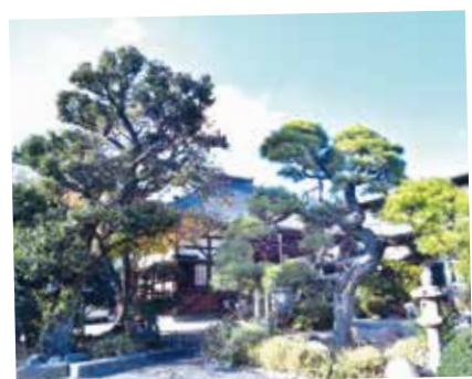
131 官要寺 瑞鳳の松と永井荷風の句碑

本堂の前庭にある瑞鳳の松は、樹齢400年と言われる黒松です。一本の枝が山門まで延びて、ちょうど鳳凰が羽を伸ばしたような姿であることに由来します。