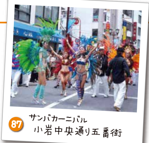
87 サンバカーニバル 小岩中央通り五番街 華やかな衣装の踊り子がサンバのリズムで五番街を彩ります。毎年7月に開催。