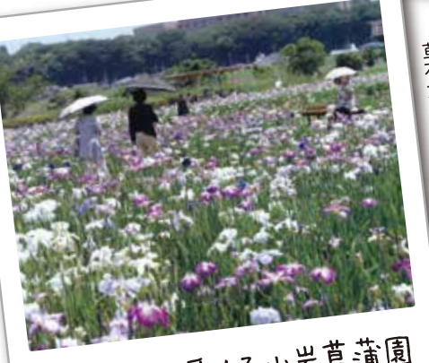
74 区民の愛する小岩菖蒲園

5月から6月に5万本の菖蒲が花を咲かせます。江戸川河川敷では菖蒲の他にも色々な草花が発見できます。ムシナモ発見の地