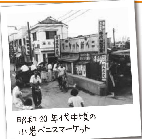
昭和20年代中頃の 小岩ベニスマーケット

戦後間もない昭和21年、小岩用水(現在の中央通り)の上には仮設店舗が立ち並ぶ、水上マーケットがつくられました。延長約300mの間に飲食店、乾物店、菓子店など30数軒がひしめき、朝夕は買物の主婦でにぎわい、戦後の典型的な空間となっていました。もともとは、駅前通り(現在のフラワーロード)に露天を営んでいた戦災者たちが、移転を余儀なくされ小岩用水上に仮設小屋を建てたのが始まりです。衛生上等の理由から地元の反対を受け、昭和37年に幕を閉じました。現在は「小岩中央通り五番街」として、にぎわいをみせています。