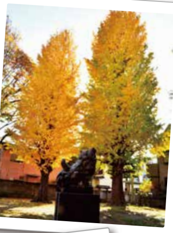
81 天空に向かう 天祖神社のイチヨウ