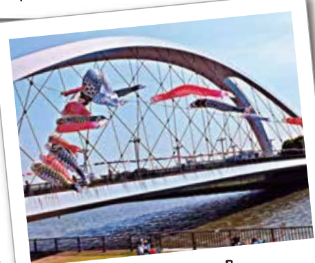
88 新中川の憩いの場辰巳新橋

平成6年に完成した、大きなアーチの橋です。毎年5月上旬に鯉のぼりが掲揚されます。