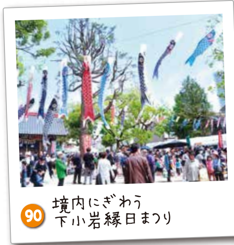
90 境内にぎわい 下小岩縁日まつり 毎年4月29日の昭和の日で開催されています。(南小岩天祖神社/南小岩六丁目児童遊園)