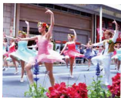
85 小岩フラワーロードのにぎわい