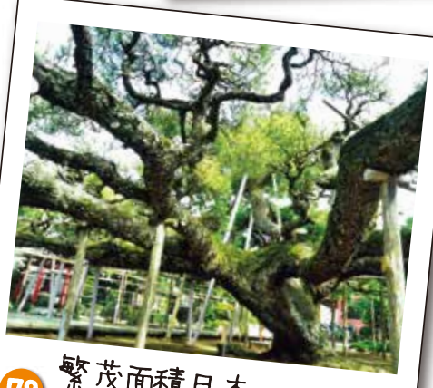
78 繁茂面積日本一 善養寺影向の松

北向き地蔵は、参道入口に祀られています。常燈明は、天保10年小岩市川の渡し場に建てられました。昭和9年の江戸川改修の際に宝林寺に移されました。