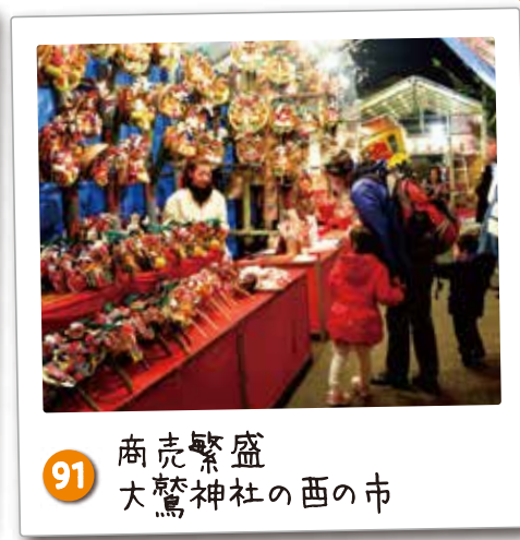
91 商売繁盛 大鷲神社の西の市 開運、商売繁盛の神として信仰されている日本武尊が祀られています。毎年11月の西の日に市が開かれます。