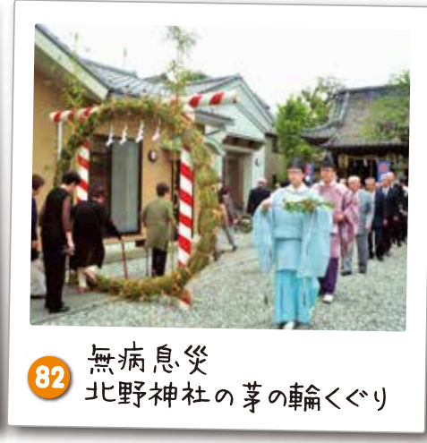
82 無病息災 北野神社の茅の輪くぐり 毎年6月25日の例祭日に行われています。直径3mの茅のできた輪の中を氏子が人形を持ってくぐる無病息災を願う行事。区指定無形文化財。